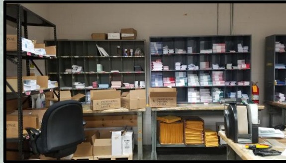
OSM: Espacio para enviar folletos